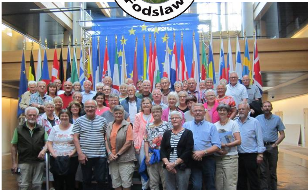
Fodslaw på besøg i Europaparlamentet september 2015