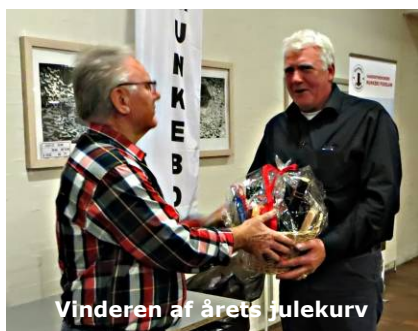
Vinderen af årets julekurv