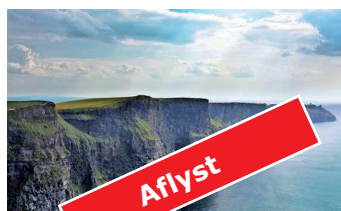
Vandrerejse Irland 8 dage (fly) 6. - 13. maj