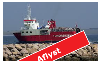
Tunø 1 dag (bus) Torsdag 28. maj