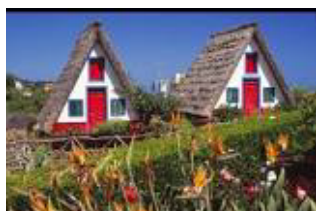
Madeira Portugal - 8 dage (fly) 2. - 9. febr.

Munkebo Fodslaw kan igen i 2020 tilbyde et varieret program af rejser i ind- og udland.