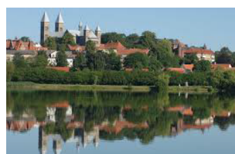
Jubilæumsvandring Viborg - 1 dag - bus søndag 20. sept.