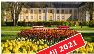
Gavnhø 1 dag (bus) Tirsdag 28. april