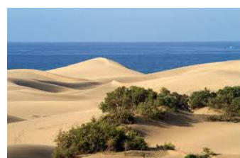
Gran Canaria 8 dage (fly) 4. - 11. nov.