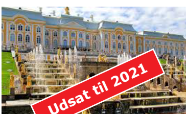
Skt. Petersborg 8 dage (bus) 24. - 31. aug.