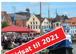
Nordfriesland 2 dage (bus) 10.-11. juni