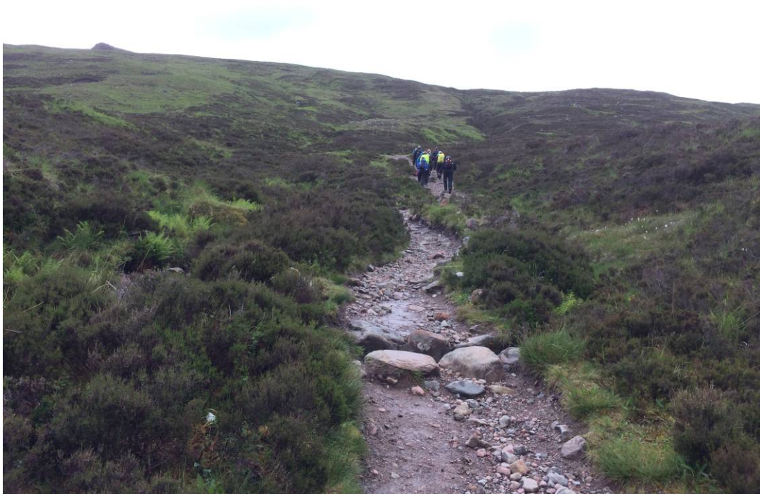
Op – op - op