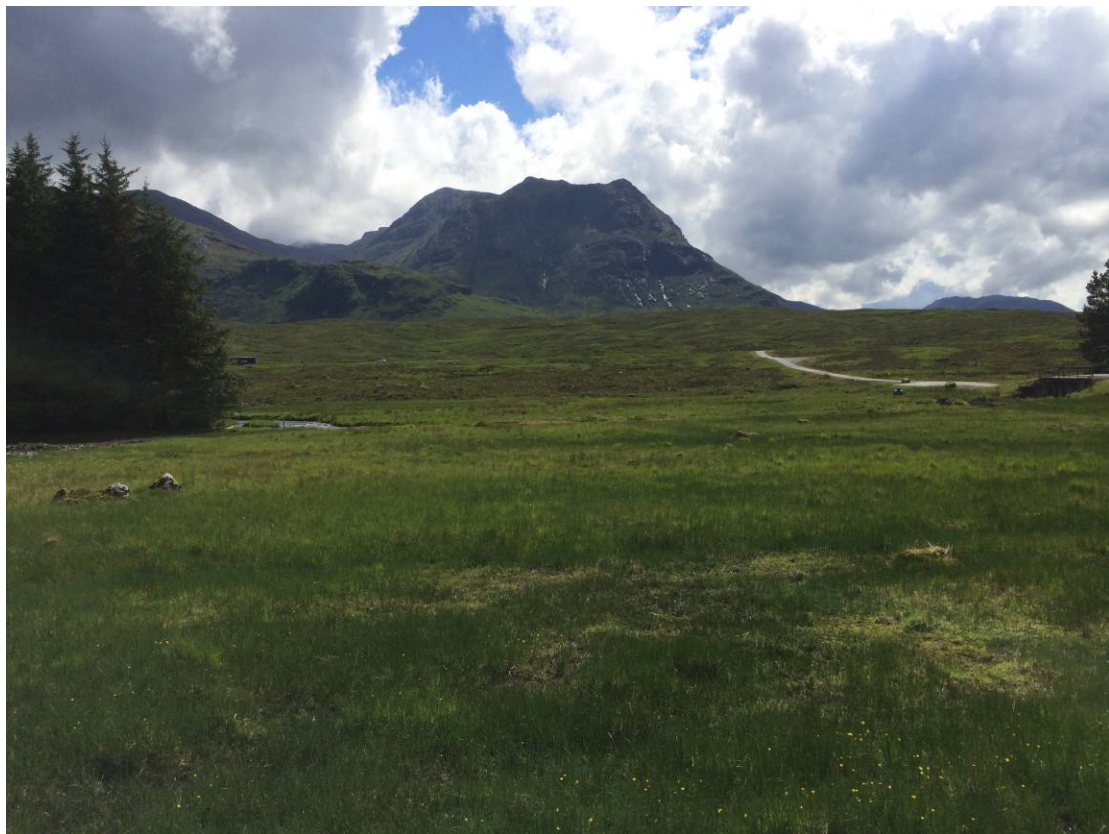
På vej mod King`s House og Glencoe.