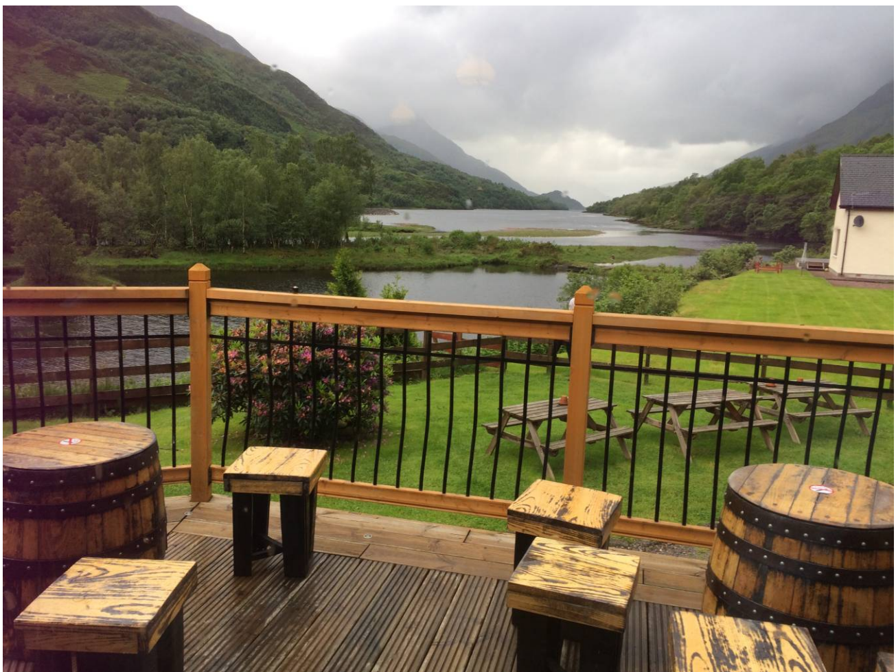
Udsigten fra vores hotel i Kinlochleven. Sidste etape står for døren. Der er ingen billeder fra denne etape. Der var simpelthen ikke overskud til at tage mobilen frem. Vi skulle vandre 24 km. sidste vandredag. Det blev vist til 28 km.. Op og ned ad bakke.