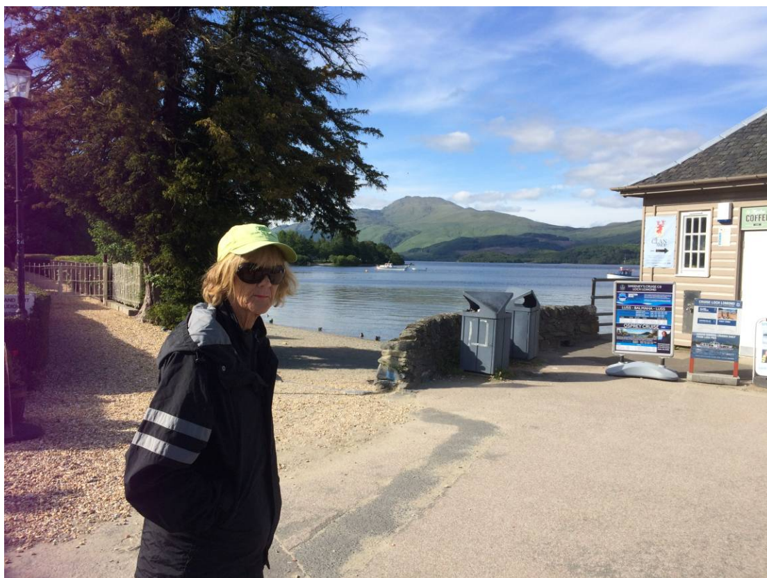
Et stop i den lille idylliske Landsby, Luss, for at strække benene og finde et toilet.