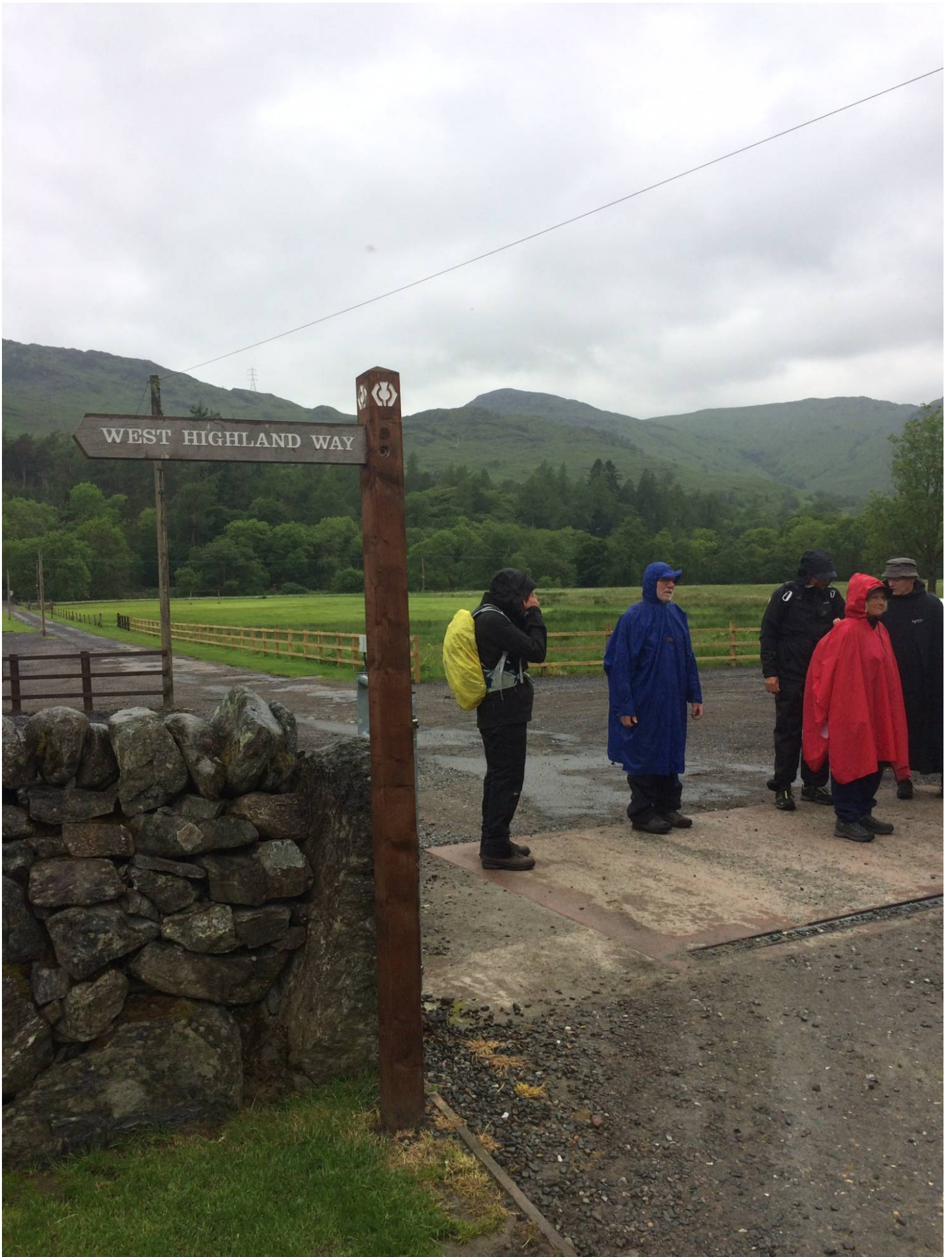
Det var vådt.