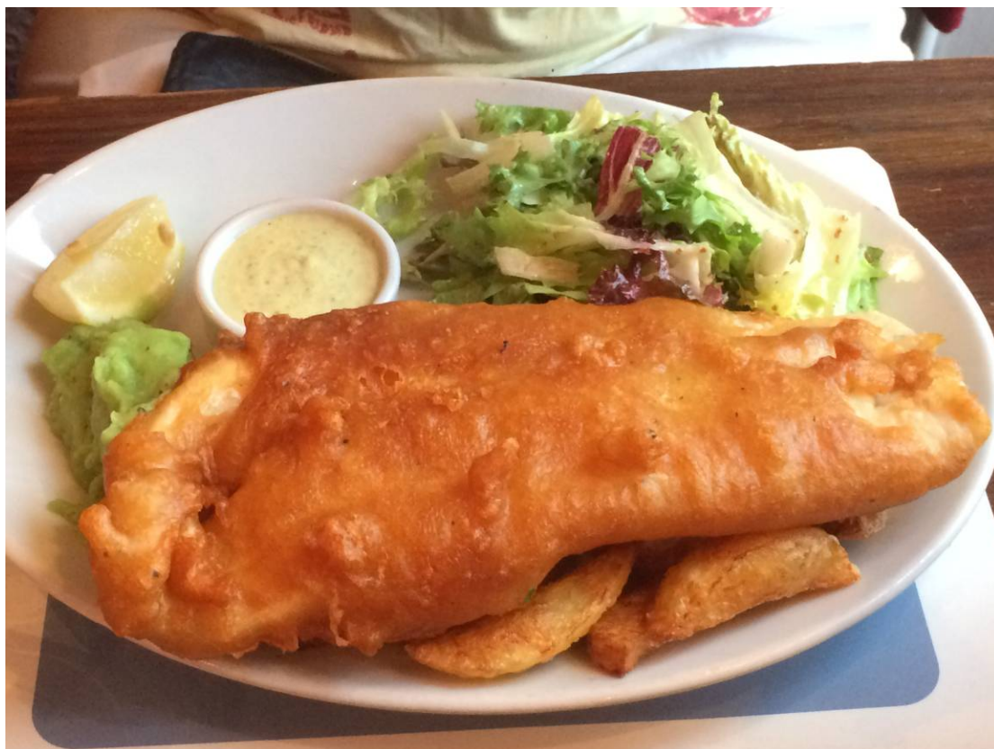
Så lækker er Monas Fish and Chips.