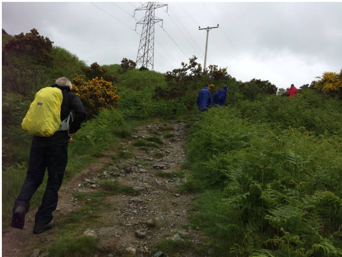
Ikke så meget jævnt terræn.