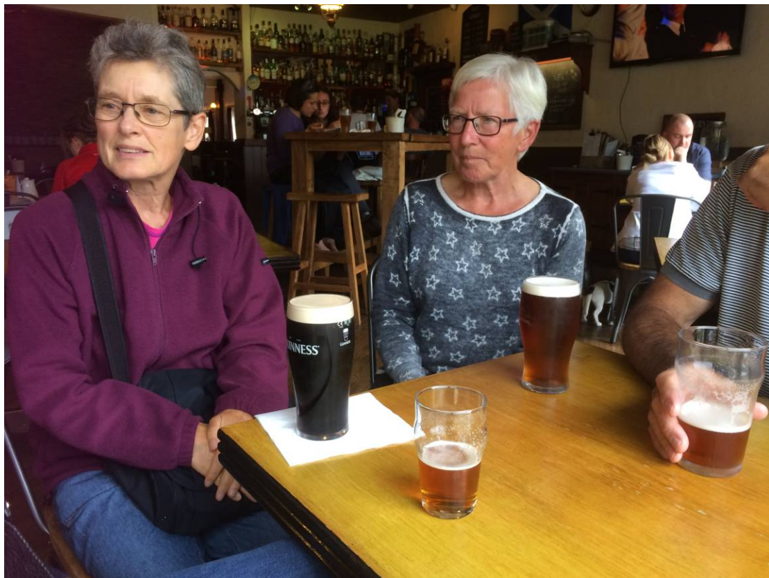
Hvem skulle tro, at to små damer kan konsumere så store øl