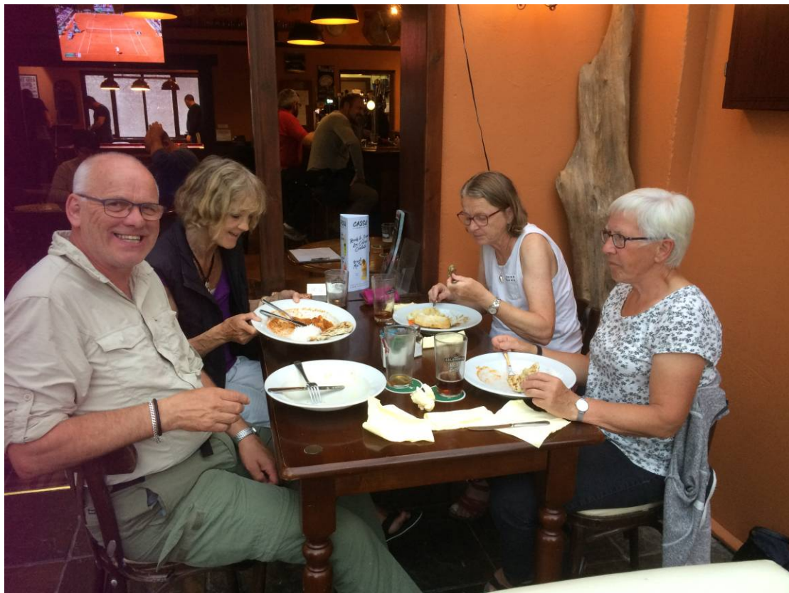
Aftensmad i Tyndrum