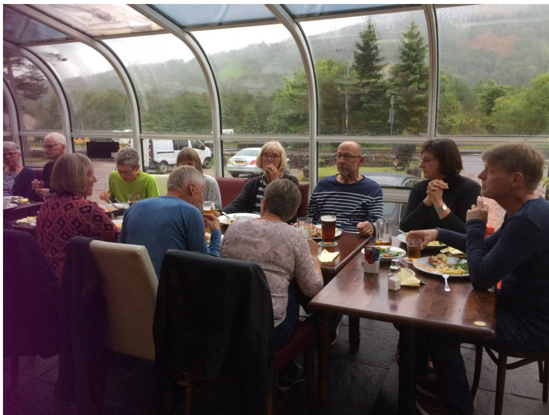
Så er vi fremme i Tyndrum –ikke så trøtte- endnu. Aftensmiden er serveret