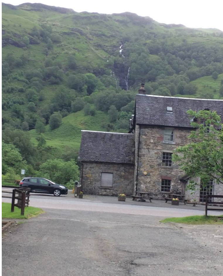
Udsigt fra vores førte hotel i Inverarnan

Endelig fremme. Og aftensmaden venter. Ventetiden bruges på at smage på nogle af de forskellige skotske øl og på hyggeligt samvær.