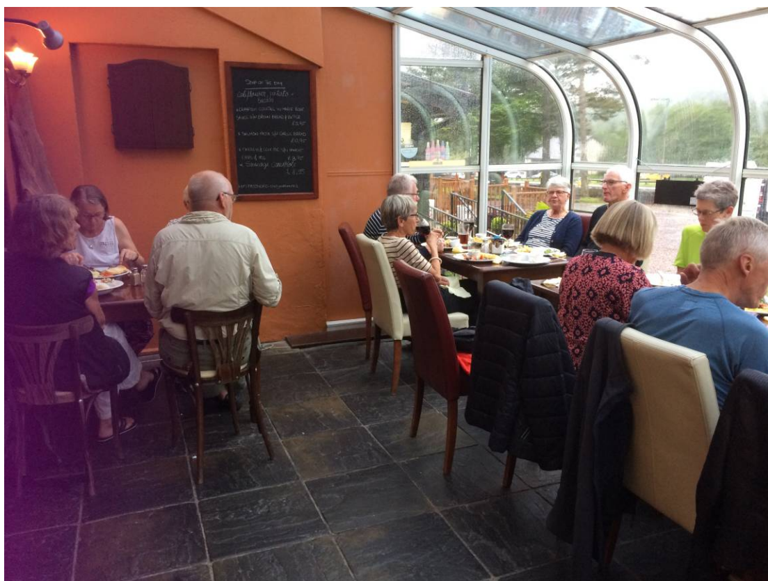
Aftensmad i Tyndrum