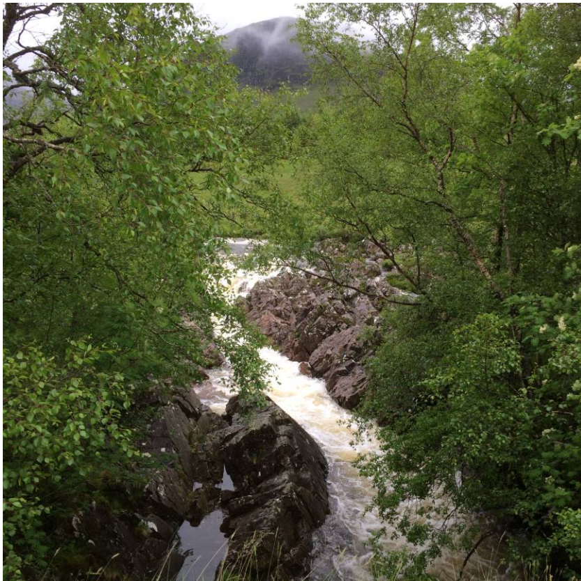
Fantastiske udsigter. Der var meget vand –store og små vandløb- med og uden broer.