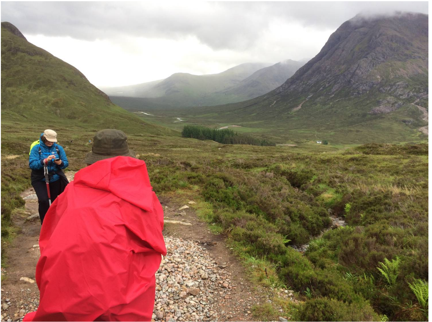
Så er vi på vej ind i Glencoe – et af Skotlands smukkeste områder