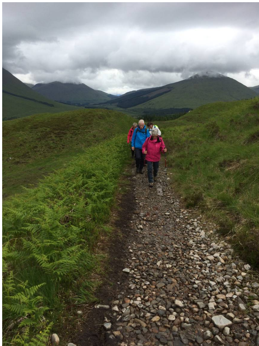
Anden dags vandring –kun 15 km. - på papiret. Blev vist nærmere 19 km. Her er terrænet pænt tørt –lidt af en sjældenhed