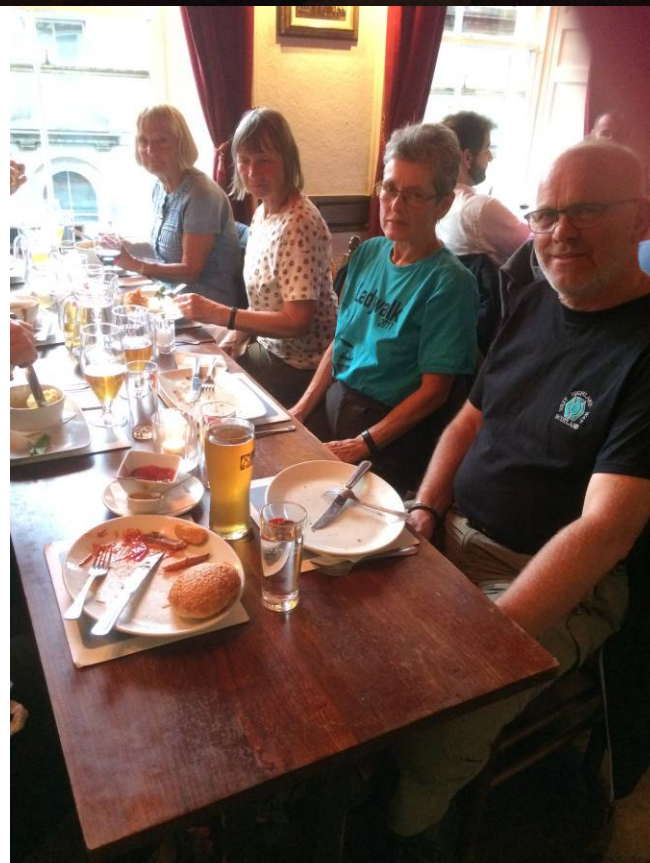
Spisning på The Doric i Edinburgh den sidste aften efter en kort bytur. Næste dag igen lidt bytur før vi vender næsen hjemad.