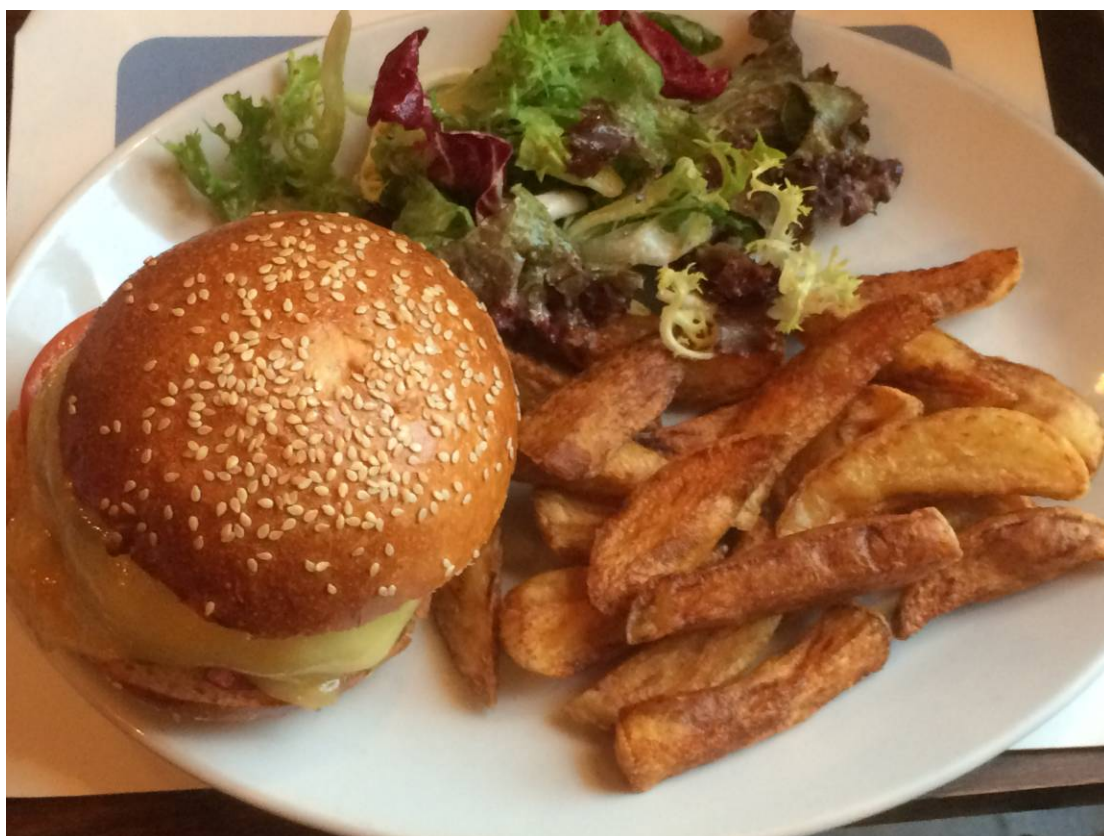
Og en god burger med skotsk oksekød til Kirsten.