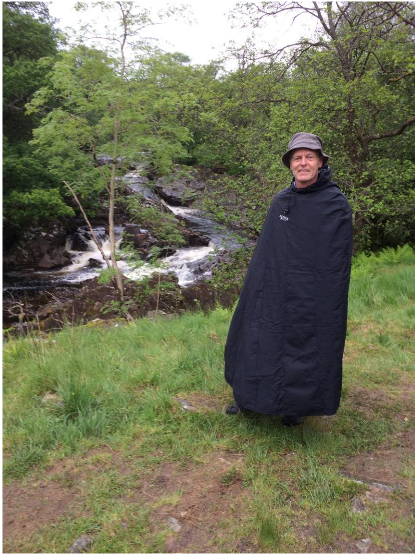
Første dags vandring 22 km. –mindst og vejret var lunefuldt